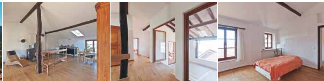
Il Cielo – grosszügiger offener Wohnraum und Schlafzimmer

Offene Wohnküche mit Holzofen, Arbeits- und Wohnnische, 2 Schlafzimmer, Bad, Loggia (gedeckte Aussichtsterrasse).