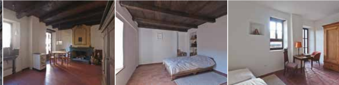
Il Coro – die ursprüngliche Küche und die Schlafzimmer

Wohnküche mit Holzherd und Cheminée, offener Arbeits-, Lese-, Frühstücksvorraum mit Morgensonne. 2 Schlafzimmer, Bad, Balkon, Garten mit Pergola