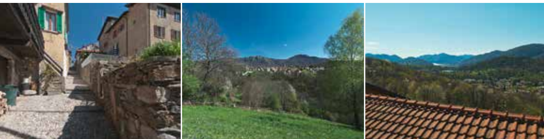
Im Nucleo basso, Sala von weitem, Sicht von der Loggia

Sala liegt auf einer südlichen Terrasse im Sottoceneri (550m ü. Meer). Von der Loggia (gedeckte Terrasse) weite Panorama-Sicht mit dem kleinen Lago di Origlio (Naturschutzgebiet), dem Monte San Salvatore und einem Zipfel des Lago di Lugano. Ebenfalls im Blickfeld ist der kleine Flughafen von Agno.