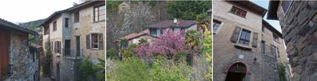
Das Haus von nah und aus der Nachbarschaft

Das Haus liegt am unteren Dorfrand mit vielfältiger Nachbarschaft. Es ist Teil der letzten Häuserzeile, die Gasse verliert sich nach dem Garten mit der Pergola im Wald.